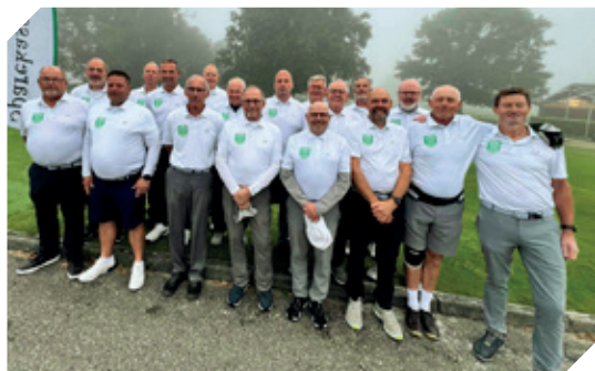
Holdet til ØM 2024.

Vi har desuden afviklet Fødselsdagsmatch, som var en rigtig hyggelig aften. Hunnematchen vandt