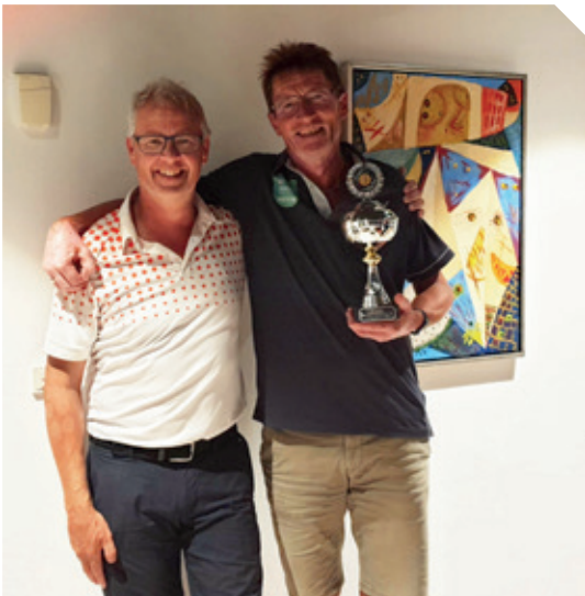
Bymatch Odder – Skanderborg de 2 captainer.